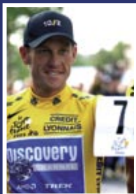
Lance Armstrong: afscheid na 7 Tourzeges