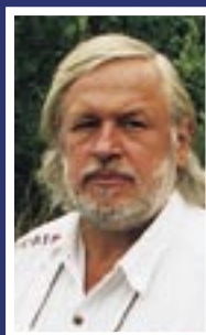
Samensteller en auteur: Herman Harens

Verkoopprijs 22,90 euro ISBN - 90-77918-02-7